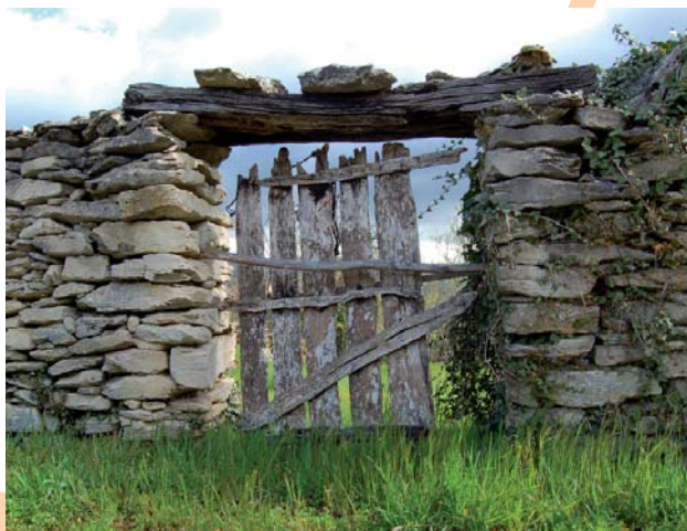
Construcciones tradicionales en Barriga

2 [KM 8,3] PICO DEL FRAILE. Llegamos al cortado asomándonos sobre las tierras de Ayala por un camino difuso en el pasto que va ascendiendo desde Mijala. Esta curiosa formación se enclava sobre la muralla de roca caliza que se desploma hacia Tertanga dando paso al Txarlazo (927 m) y la Virgen de la Antigua.