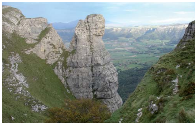
Vistas del Pico del Fraile