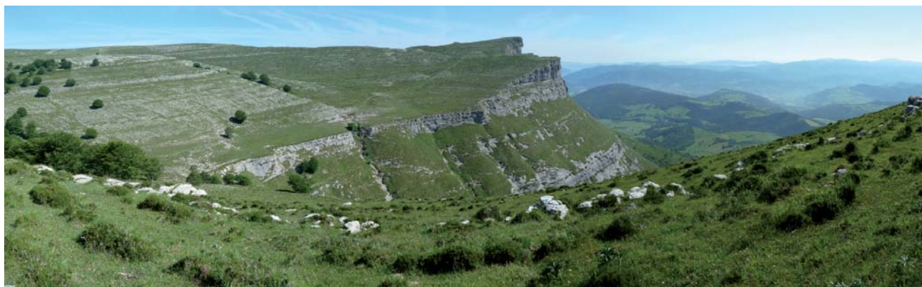
Cortados y pastizales de altura